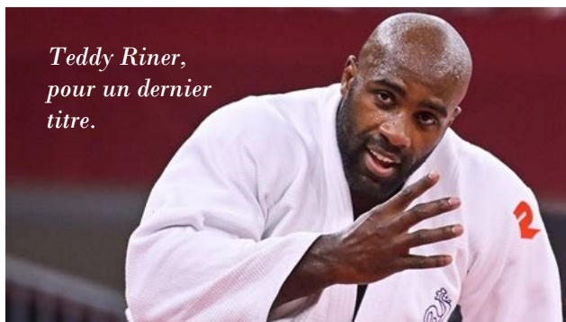
Teddy Riner, pour un dernier titre.