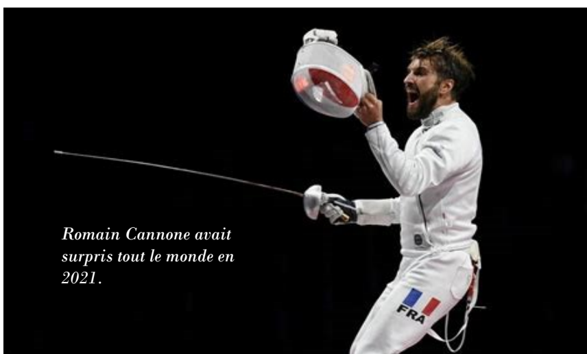
Romain Cannone avait surpris tout le monde en 2021.

La particularité de ce sport c'est que les arbitres parlent... français ! « Allez » pour lancer l'assaut par exemple. « L'attaque part de droite, à gauche touché ». Oui, car il y a, notamment au sabre, un système de priorité assez complexe à comprendre, surtout que tout