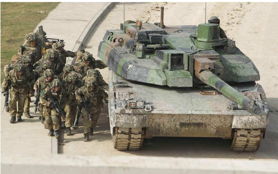
Un char Leclerc appuyé par l'infanterie.