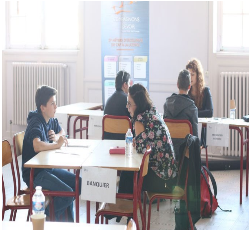
La professionnelle de la banque a reçu beaucoup d'élèves.

Il y a quand même eu quelques imprévus comme les absences de l'hôtesse de l'air, du concepteur sites web et applications mobiles, du spécialiste réseaux, de l'analyste programmeur, de l'administrateur